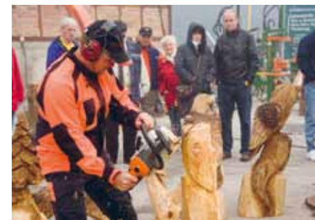
...so die Großen