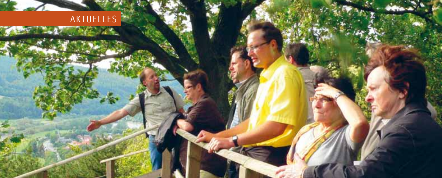
Exkursion in den Nationalpark Kellerwald-Edersee.