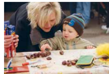
Basteln mit Naturmaterial: Wie die Kleinen...