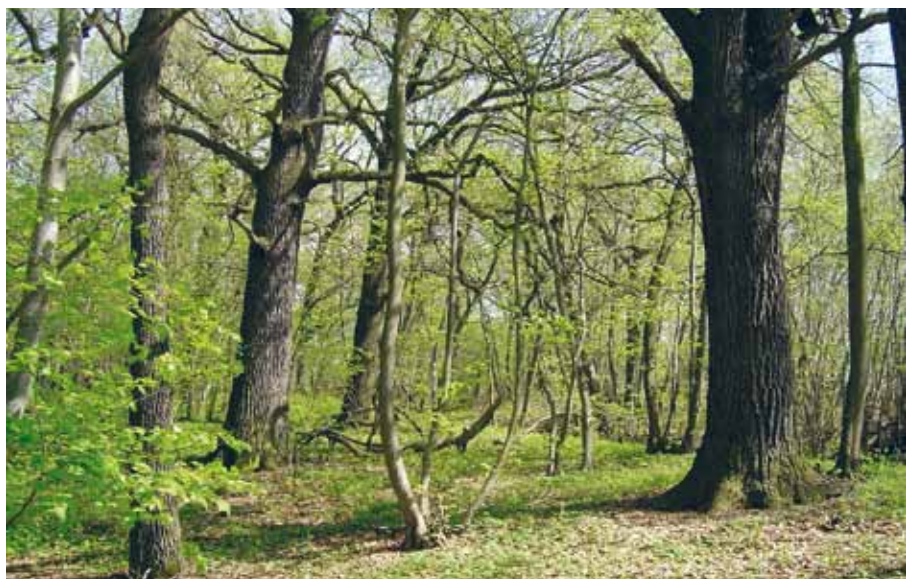
Ein typischer Mittelwald

Bei dieser schon aus dem Mittelalter überlieferten Waldnutzungsform (wie sie außer in Niedersachsen vor allem auch in Franken gepflegt wird) liegen die ökonomischen Vorteile auf der Hand: Neben der energetischen Effizienz des Unterholzes schaffen die Stämme der Überhälter zusätzliche Werte. Weil ihr Umfeld etwa alle 30 Jahre durch den Stockhieb freigestellt wird, entwickeln sich besonders formstabile und belastbare Holzstrukturen. Fünf bis acht Prozent der schafffreien Stämme sind sogar furniertauglich. In ökologischer Sicht bietet der Mittelwald abwechslungsreiche Lebensräume. Studien aus der Nähe von Göttingen und aus Oberbayern zeigen, dass ein strukturreicher Mittelwald mindestens so artenreich wie ein naturnaher Wald sein kann, auch wenn vom Mittelwald andere Arten als vom naturnahen Wald profitieren.